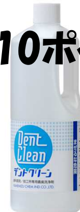
デントクリーン 1.2L×1本