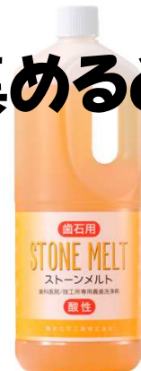
ストーンメルト 1.8L×1本