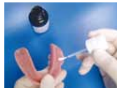
写真2 接着材 “コートライナー”の塗布