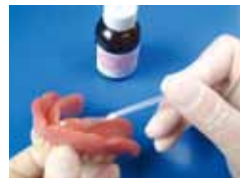
写真5 “オキシバリアー”の 塗布