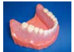
写真3 口腔内への挿入