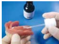
写真4 表面滑沢材 “コートライナー”の塗布