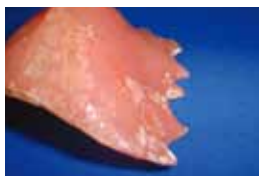
写真1 水洗のみによる表面の石灰化 （3ヶ月後）