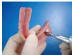
写真1 床粘膜面の削除