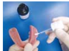
写真2 接着材 “コートライナー”の塗布