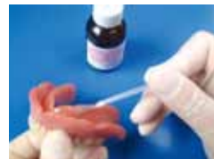
写真5 “オキシバリアー”の 塗布