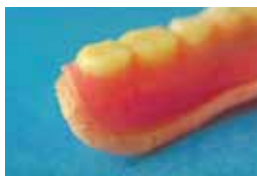
写真2 不適当な市販義歯洗浄剤による 表面への気泡発生