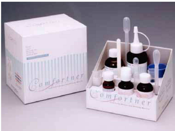
粉/60g 液/50mL コートライナー/20mL その他

“コンフォートナー”は、“酵素入りポリデント” が使える、耐久性が飛躍的に向上!