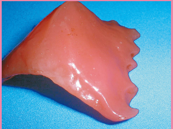
クリーンソフトを使用して3ヶ月間装着