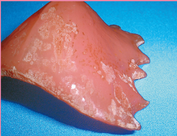
水洗いのみで3ヶ月間装着